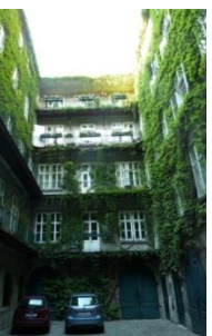
[14] Weihburggasse 21