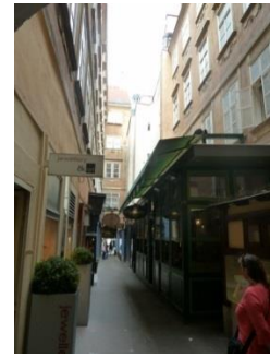
[3] Schmeckender Wurmhof