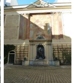
[17] Damenstift Johannesg. 15