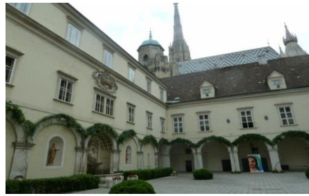
[2] Erzbischöfliches Palais, Teperantiahof