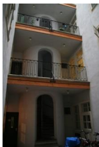
[15] Ballgasse 4