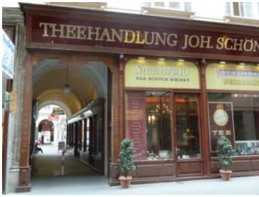
[1] Zwettlhof, Stephansplatz 6