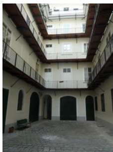
[7] Grünangergasse 1