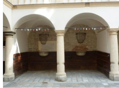
[5] Bäckersstraße 7, Haus Stampa