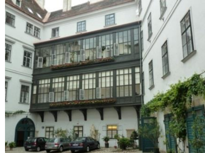
[9] Deutschordenshof, Singerstraße 7