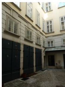
[16] Himmelpfortg. 13