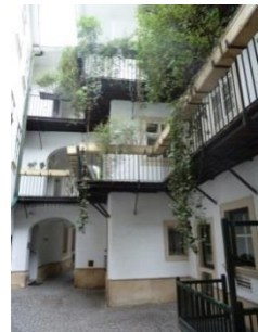
[8] Blutgasse 3