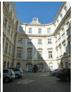
[12] Palais Rottal