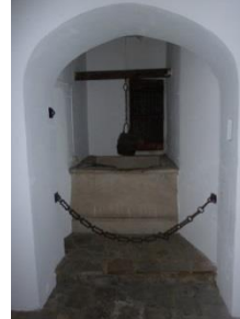
[16] Himmelpfortg. 15