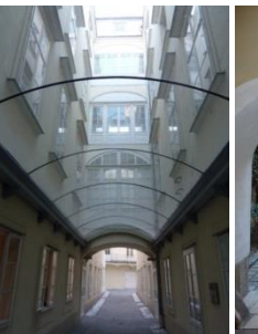
[14] Weihburgg. 14