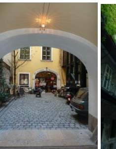
[14] Weihburgg. 16