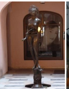
[13] Franziskanerplatz 6