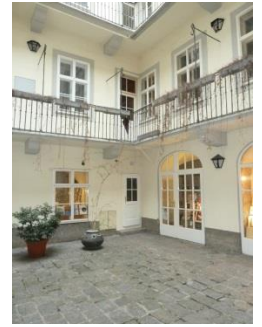
[3] Bäckersstraße 2