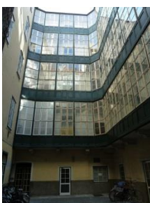
[14] Weihburgg. 22