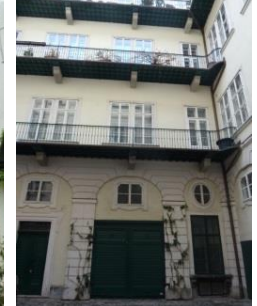
[10] Palais Neupauer-B.