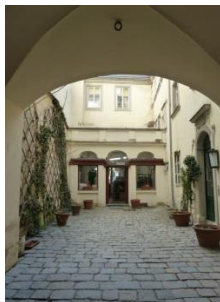
[11] Alter Domprobsthof