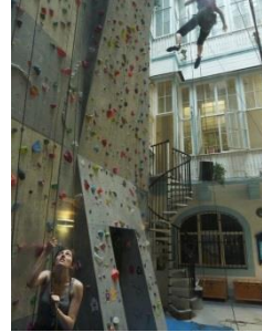
[5] Bäckersstraße 16