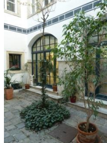
[16] Himmelpfortg. 15